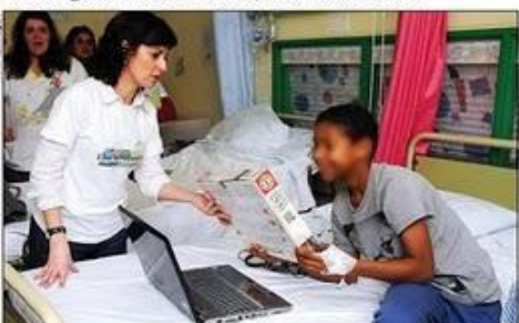
Após a entrega de materiais, crianças internadas ficam felizes com os materiais recebidos, como por exemplo este pacote de 1000 peças...